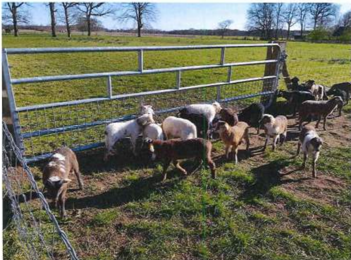
De lammeren hebben verschillende kleuren en tekening.

Hiervoor is in de aanbiedingsbrief al even het belang aangegeven van onze subsidieverstrekkers. Naast de daar genoemde instellingen wordt ook jaarlijks van Natuurmonumenten en Staatsbosbeheer een bedrag ontvangen. Incidenteel wordt ook van particulieren in de vorm van een gift of een legaat bijdragen ontvangen.