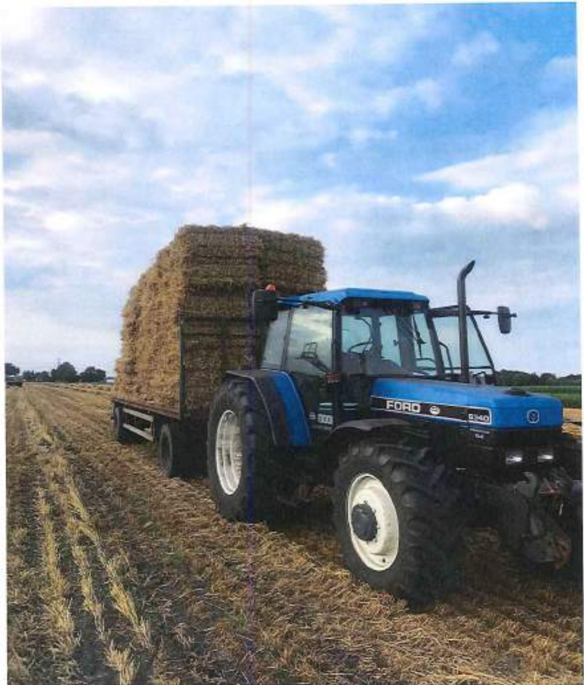
Voorbereiden op de winter.