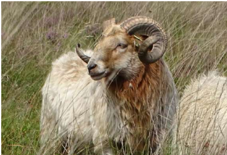
Een mooie karakteristieke kop van een ram van het ras Drents Heideschaap

Stichting Vrienden om elk jaar opnieuw een sluitende begroting te krijgen. Het tekort uit de bedrijfsvoering wordt aangevuld met gelden van ondermeer donateurs, sponsors en toeristische activiteiten. De extra bijdrage van de provincie Drenthe van € 7500,- is daarbij van groot belang en helpt ons mede om financieel gezond te blijven.